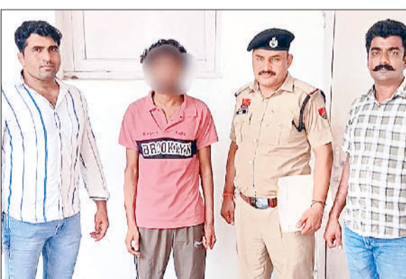
झंझर। पकड़ा गया आरोपी पुलिस टीम के साथ।