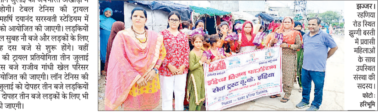
झज्जर। रहगिया रोड स्थित झुग्गी बस्ती में प्रवासी महिलाओं के साथ उपस्थित संस्था की सदस्य।

वर्ल्ड डॉक्टर्स-डे के उपलक्ष्य में इंडेथ विजन फाउंडेशन और सेवा ट्रस्ट यूके इंडिया द्वारा प्रवासी महिलाओं के लिए स्वास्थ्य जागरूकता कार्यक्रम का आयोजन किया गया। संस्था सदस्यों ने शहर की बाहरी क्षेत्र में स्थित झुग्गी बस्तियों में रहने वाली प्रवासी महिलाओं को मासिक धर्म स्वच्छता के प्रति जागरूक किया। इंडेथ