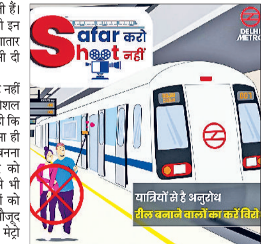
बहादुरगढ़। डीएमआरसी की अपील से संबंधित एक पोस्टर।