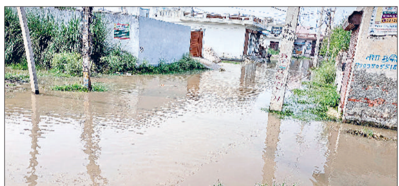
झंझर। शहर की नीम आली कॉलोनी में हुआ जलभराव।

बरसात के कारण हुए जलभराव ने प्रशासन की जलनिकासी के दावों की पोल खोल कर रख दी है। बरसात के दौरान जहां अधिकांश शहर में जलभराव हो गया, वहीं बरसात रूकने के बाद भी कई रिहायशी क्षेत्रों में जलभराव से लोगों को ख़ासी परेशानियों को सामना करना पड़ रहा है। वार्ड नंबर एक में कई गलियों के अलावा, वार्ड नंबर चार की नीम आली कॉलोनी की हालत बद से बदतर है। स्थिति यह है कि यहां लोगों का अपने घरों से बाहर निकलना भी मुश्किल हो रहा है। बुद्धो माता मंदिर से कच्चा सुखेपुर मार्ग पर एक से डेढ़ फीट तक पानी भरा हुआ है। लोगों को कहना है कि प्रशासनिक स्तर पर जल निकासी की कोई व्यवस्था नहीं की गई। नालों की सफाई उचित ढंग से नहीं की गई। जिसका खामियाजा आमजन को भुगतना पड़ रहा है। विभागीय के अनुसार झंझर में 19 एमएम, बादलों में 16 एमएम, बेरी में 8 एमएम, मातनहेल में 25 एमएम और साल्हावास में 28 एमएम बारिश दर्ज की गई।