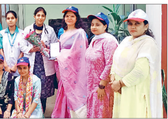
झज्जर। सीएचसी बादली में लोगों की रक्त जांच करते हुए स्वास्थ्यकर्मी।