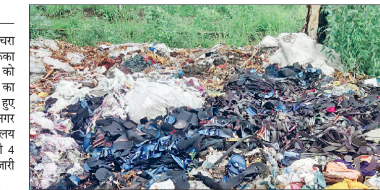
बहादुरगढ़। सड़क किनारे पड़ा मिला इंडस्ट्रियल वेस्ट।

सड़क किनारे ग्रीन बेल्ट में पड़ा मिला इंडस्ट्रियल और सॉलिड वेस्ट चार फैक्ट्रियों को एचएसपीसीबी ने जारी किए कारण बताओ नोटिस हरिभूमि न्यूज़ ► बहादुरगढ़ शहर में ठोस कचरा और औद्योगिक कचरा सड़क किनारे ग्रीन बेल्ट में खुलेआम फेंका जा रहा है, जिससे न केवल पर्यावरण को नुकसान पहुंच रहा है, बल्कि बीमारियों का खतरा भी बढ़ गया है। इसे देखते हुए हरियाणा राज्य प्रदूषण नियंत्रण बोर्ड ने नगर परिषद, खंड विकास एवं पंचायत कार्यालय और एचएसआईआईडीसी के साथ ही 4 कंपनियों को कारण बताओ नोटिस जारी किए हैं। बता दें कि शहर के विभिन्न औद्योगिक क्षेत्रों में फैक्ट्रियों से रोजाना भारी मात्रा में इंडस्ट्रियल वेस्ट उत्पन्न होता है। इस औद्योगिक कचरे को सुनिश्चित ढंग से निस्तारित करने की बजाय सड़कों के किनारे ग्रीन बेल्ट या खाली जगहों में जहां-